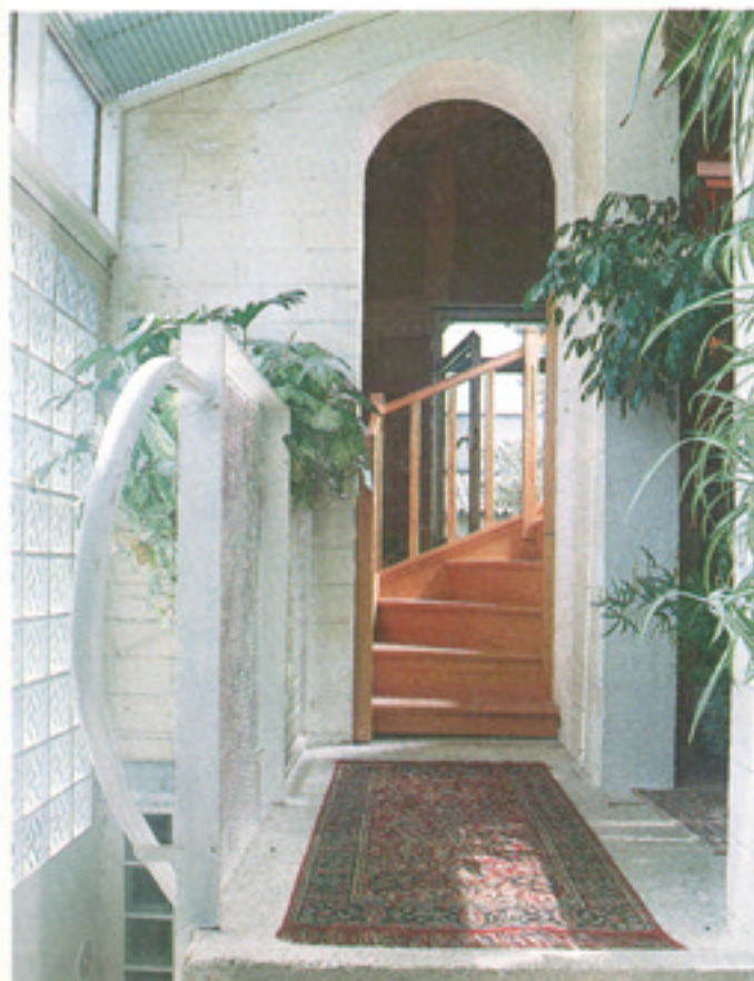
Gagner 80 cm de large vers l'extérieur donne accès à l'univers parents en sous-sol. Créée dans le mur extérieur d'origine, une ouverture en arrondi conduit à l'escalier d'étage.

Côté entrée, le choix s'est porté sur deux parois entièrement translucides : un châssis à double vitrage (comme la toiture) surmonte le mur en briques de verre. En complément, d'autres briques de verre relient la lumière de l'entrée dans la salle de bains des parents et dans la cuisine.