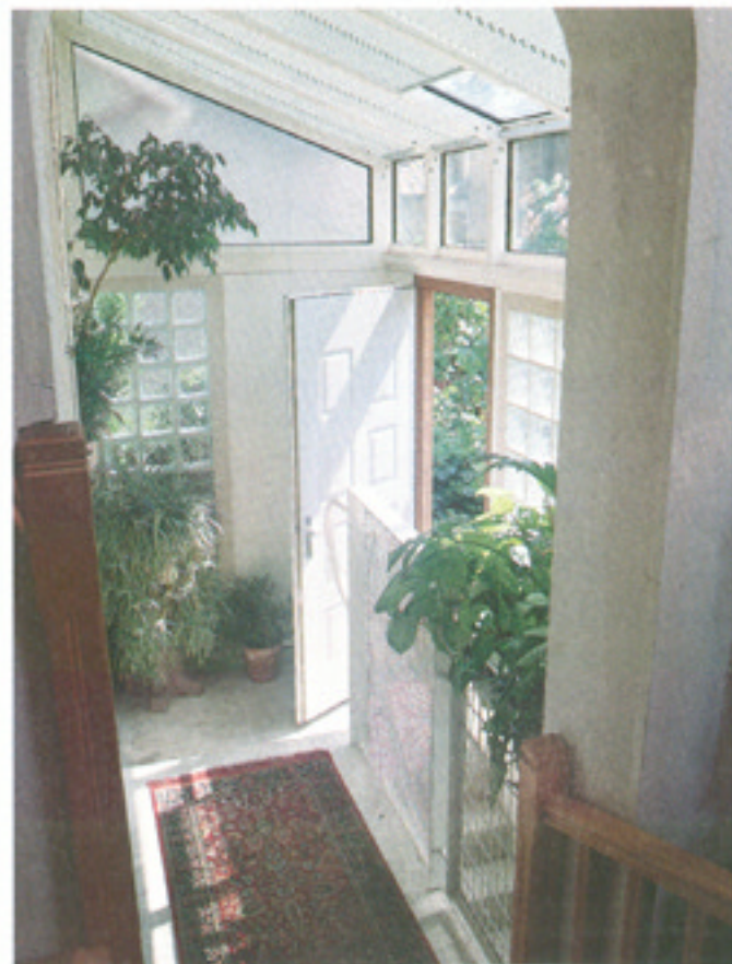
La nouvelle entrée est très lumineuse. Les stores aluminisés protègent efficacement du soleil. Les briques de verre font circuler la lumière entre sous-sol, façade et cuisine.